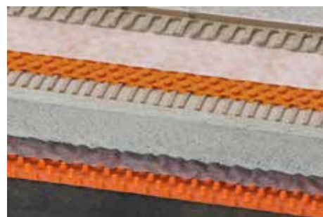
Schlüter-TROBA-PLUS 8 (12)

Ze względu na układanie płyt luzem na grysie lub żwirze względnie na podstawach, przy jednostronnym obciążeniu lub nacisku w narożnikach może naturalnie dojść do przesunięć powierzchni układanych płyt. W przypadku konstrukcji na podłożu żwirowym lub grysowym < 5 cm może wystąpić lekki efekt klawiszowania. Aby tego uniknąć zalecamy układanie na Schlüter-TROBA, w tym celu zapoznaj się z prospektem 7.1.