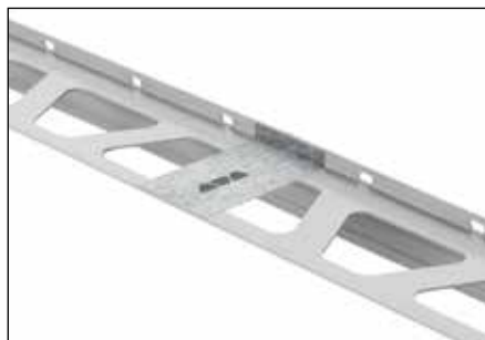
Uszczelnienia styków z Schlüter®-BARA-HV