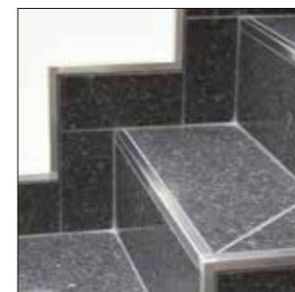
Krawędź stopni schodowych i wykończenie cokołu

Schlüter®-QUADEC jest profilem brzegowym do zewnętrznych narożników okładzin ceramicznych i płytek cokołowych. Różnorodne materiały, kolory i powierzchnie licowe umożliwiają odpowiedni dobór kolorystyczny razem z płytkami i i spoinami oraz dają możliwość tworzenia interesujących kontrastów. Profile chronią krawędzie przed uszkodzeniami. Wersja profila wykonana w stali nierdzewnej nadaje się także do stosowania jako wykończenie krawędzi posadzki lub krawędzi stopni schodowych. Profile stosować można także do zakończeń krawędzi, narożników i przykryć cokołów innych materiałów takich jak wykładziny podłogowe lub parkiet.