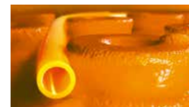
Schlüter®-BEKOTEC-THERM Ceramiczna posadzka klimatyzowana