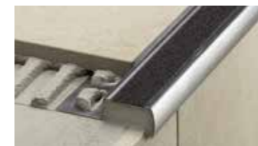
Schlüter®-TREP antyślizgowe profile schodowe