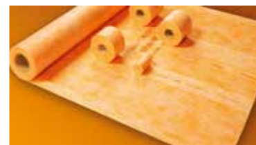
Schlüter®-KERDI dokładne i łatwe uszczelnienie