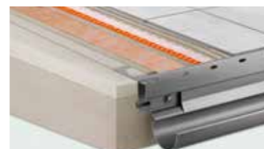
Schlüter®-system konstrukcji balkonowych kompletne rozwiązanie dla nowo wznoszonych budynków, stosowane także przy renowacji balkonów i tarasów